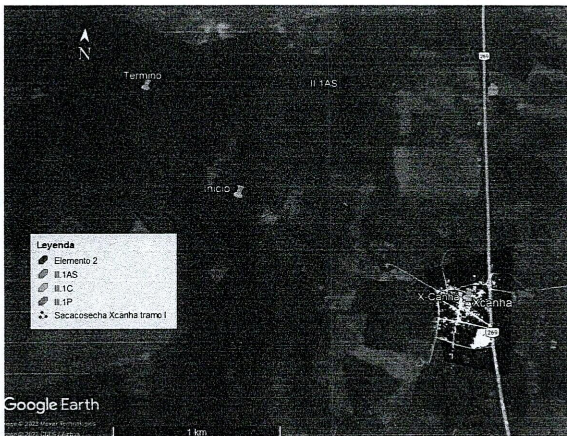
Figura 1.- Se señala el sitio propuesto del proyecto en la unidad de gestión ambiental II.1AS en base al Programa de Ordenamiento Ecológico Local del Municipio de Hopelchén.

Segundo: En base a las coordenadas del proyecto cuya pretendida ubicación en la localidad de Xcanha Municipio de Hopelchén, cuyas coordenadas UTM del tramo I; inicio X 252950, Y 2114189 y de termino X 252178, Y 2115020; se determina que el proyecto se ubica en la Unidad de Gestión Ambiental II.1AS en base al Programa de Ordenamiento Ecológico Local del Municipio de Hopelchén, como a continuación se señala: