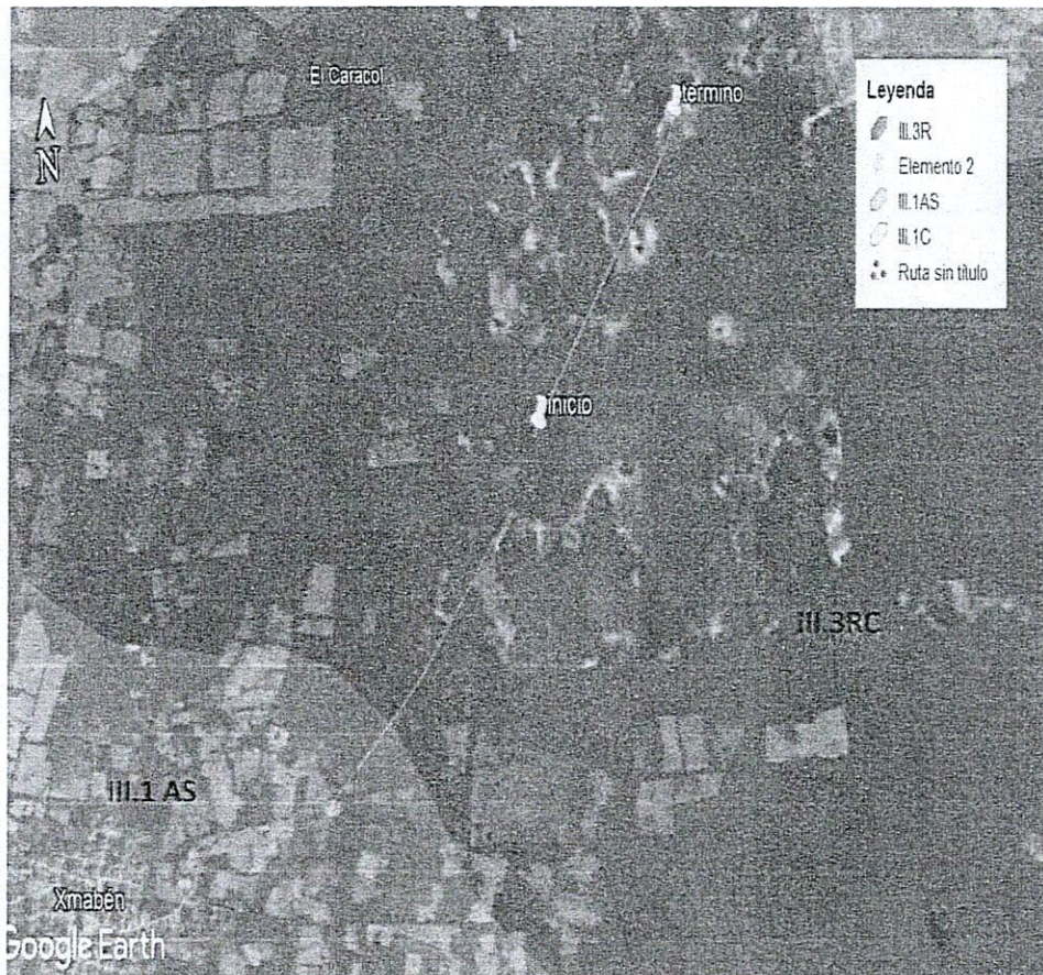
Figura 1.-El sitio propuesto del proyecto del tramo I se ubica en la unidad de gestión ambiental III.3R en base al Programa de Ordenamiento Ecológico Local del Municipio de Hopelchén.

Segundo: En base a las coordenadas del proyecto cuya pretendida ubicación en Xmabén, cuyas coordenadas UTM de inicio: X 260463, Y 2130972; Termino X 261879, Y 2132940, se determina que el proyecto se ubica en la Unidad de Gestión Ambiental III.3R, en base al Programa de Ordenamiento Ecológico Local del Municipio de Hopelchén, como a continuación se señala: